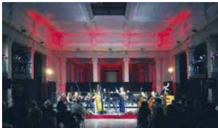
Milano, Palazzina Liberty, giugno 2018: Flauto e Arpa per Mozart (MtAmOr-festival)

In eleganti sale o in moderni auditorium gli studenti del Conservatorio di Como avranno l'opportunità di proporre i loro programmi musicali ad un pubblico sempre diverso.