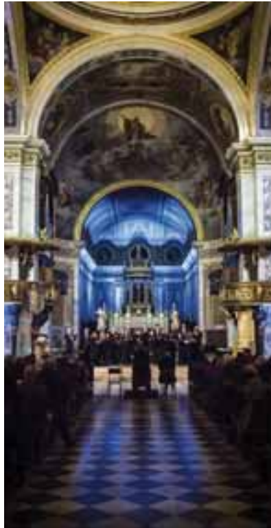
Vigevano, Duomo. Concerto di Natale con il Coro da Camera del Conservatorio di Como