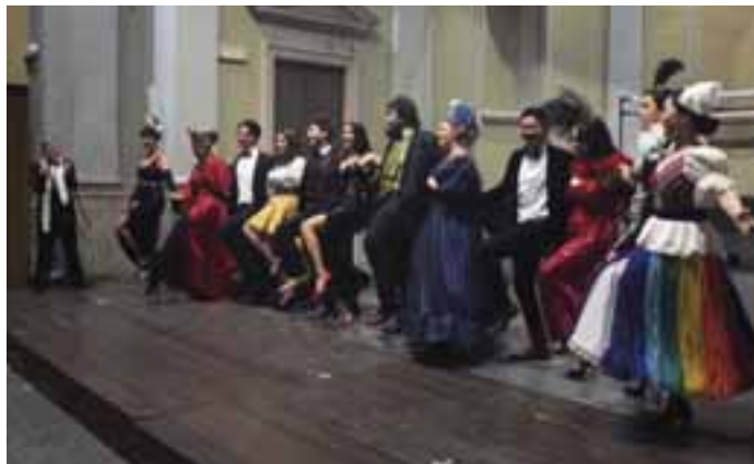
Sabato in Musica con l'Operetta Concerto di chiusura del laboratorio

Venerdì 14 e Sabato 15 Giugno 2019- Aula Percussioni e Auditorium del Conservatorio LABORATORIO: «MUSICA DA CAMERA PER PERCUSSIONI», PARTE SECONDA* DOCENTI DEL QUARTETTO TETRAKTIS - a cura di Paolo Pasqualin Il laboratorio è aperto agli studenti del Conservatorio di Como e a partecipanti esterni