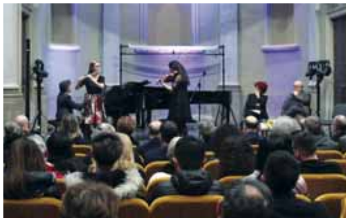
Visita del Ministro Valeria Fedeli (30 Gennaio 2017) Momenti musicali con gli studenti del Conservatorio di Como