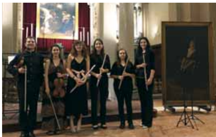
Milano, Fondazione Ca' Granda Fedeli alla Ca' Granda - Giovani Talenti in concerto