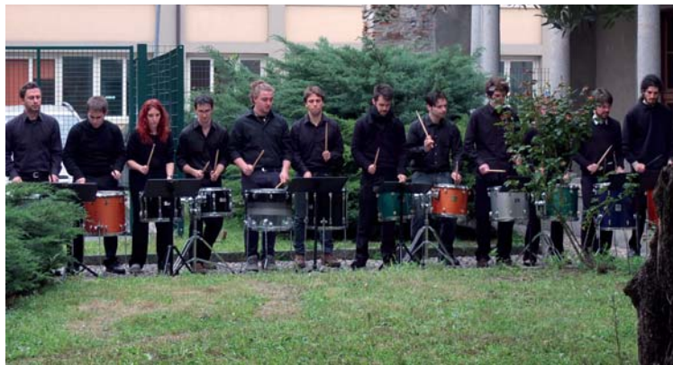
«Bazar della Musica 2014» Como, Chiostro del Conservatorio. Ensemble di Percussioni del Conservatorio.